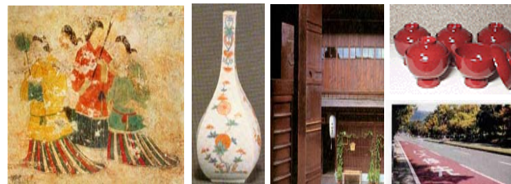
ベンガラのさまざまな用途