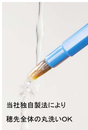
当社独自製法により 穂先全体の丸洗いOK