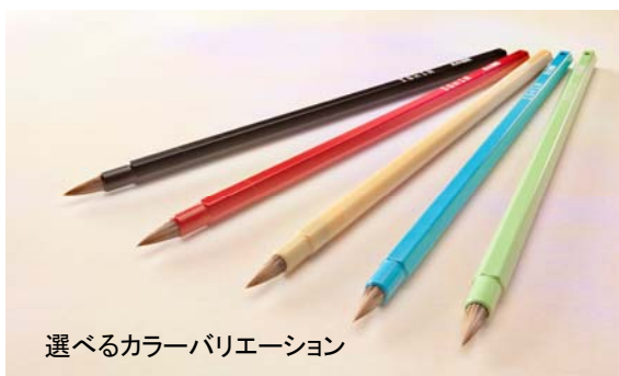
選べるカラーバリエーション

経済産業大臣指定伝統的工芸品にも指定され、広島県の特産品である『川尻筆』の技術をベースに、中四国で唯一書道学科を擁する安田女子大学文学部の谷口邦彦准教授、穴吹デザイン専門学校、地元成型会社との共同開発で「水で丸洗いしても書き味が持続」「手になじみ、持ちやすく書きやすい六角形の軸」「高いデザイン性」を持った画期的な小筆を完成させました。大手量販店様、文具店様、教育関係者様から高い評価を頂いております。